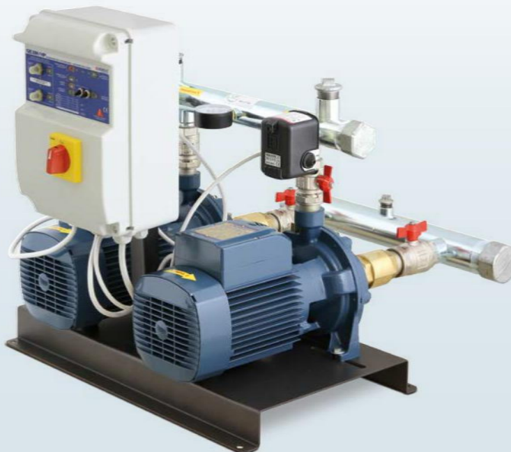
CB2 - 2CP